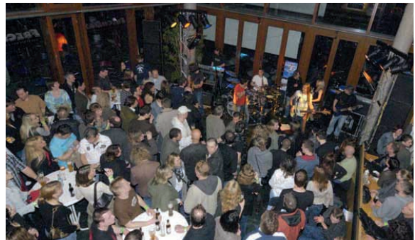
Immer viel los bei der „Polarnacht“ im März in Böblinger Lokalitäten

Weitere Informationen erhalten Sie Online unter: www.boeblingen.de