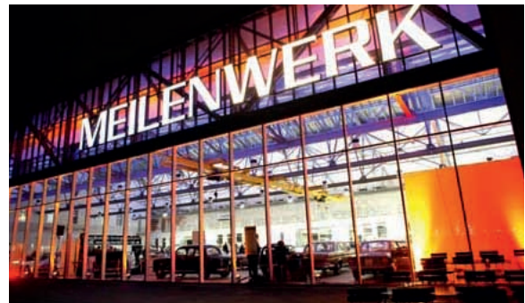
Meilenwerk – die erste Adresse für Easy-Rider und Sportwagenfans

Sensapolis Flugfeld Böblingen/Sindelfingen, Melli-Beese-Straße 1 Tel. 07031/204853-0 Fax 07031/204853-15 Internet: www.sensapolis.de