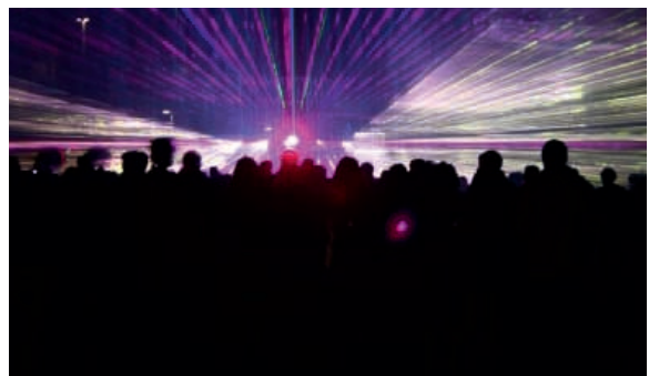
Atemberaubende Lasershow bei der Langen Nacht der Museen