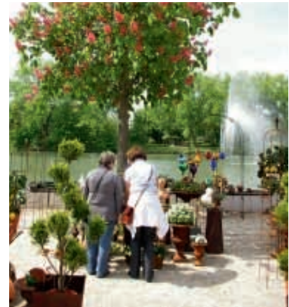
Viel zu entdecken gibt es bei der Veranstaltung „Kunst und Garten“