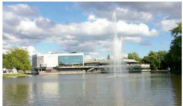
CongessCenter Böblingen/Sindelfingen