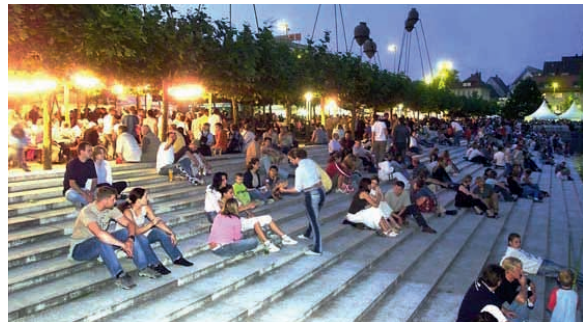
Romantische Atmosphäre bei „Schlemmen am See“ im Juli

Neuansiedlungen sind herzlich willkommen. Hochwertiges Bauland wird auf dem Flugfeld Böblingen/Sindelfingen mit optimaler Verkehrsanbindung an die Bundesautobahn A81, Flughafen und Neue Messe Stuttgart angeboten.